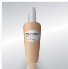
Présentation Flacon de 200 ml