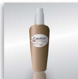
Présentation Flacon de 200 ml